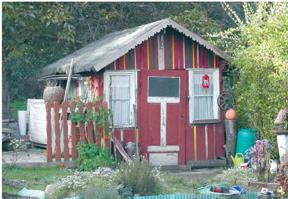
Eine historische Laube im Kleingärtnerverein „Immerglück“ e.V.

Über Kriegsschäden in der Anlage ist nichts bekannt. In einem Adress-