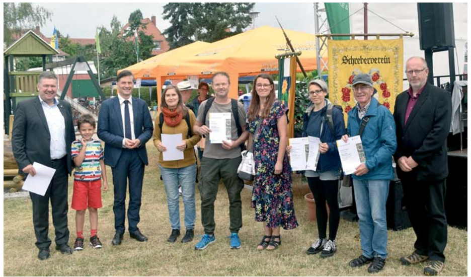
Auszeichnungen sind stets ein Höhepunkt beim Tag des Gartens.

Manche Vereine verbinden den Tag mit der Übergabe bzw. Einweihung neu geschaffener Einrichtungen auf Gemeinschaftsflächen (z.B. Kinder-