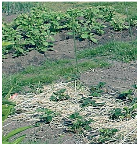
Eine leichte Mulchschicht mit Stroh zwischen Erdbeeren.

scher Mulch ist wesentlich besser und günstiger. Ein großer Teil fällt im Gar-