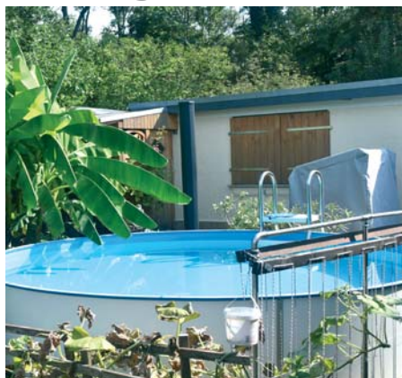
Ein Pool im Garten muss bei Pächterwechsel entfernt werden.

ermittlung von bestätigten Wertermittlern der zuständigen Kleingärtnerorganisation durchgeführt. Damit wird gemäß der gültigen Wertermitt-