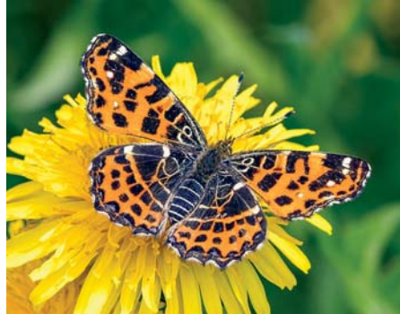
Die Frühjahrs- und Sommergeneration (r.) des Landkärtchens unterscheiden sich deutlich.

nerationen derselben Art handelt, die sich äußerlich stark unterscheiden.