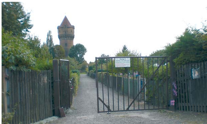
Die Anlage des KGV „Freiland“ e.V. mit dem markanten Wasserturm im Hintergrund.

Von Anfang an war die Arbeit mit Kindern und Jugendlichen fester Bestandteil des Vereinslebens. Dafür wurden extra Spielleiter ausgebildet, die die Betreuung der Kinder in ihrer Freizeit übernahmen. Im Jahr 1921 wurde das neugebaute Vereinshaus mit einer Grundfläche von 300 m 2 in Betrieb genommen und bis Ende der 1950er Jahre bewirtschaftet. In den Folgejahren wurde es an verschiedene Firmen vermietet. Später sanierten die Vereinsmitglieder ca. 150 m 2