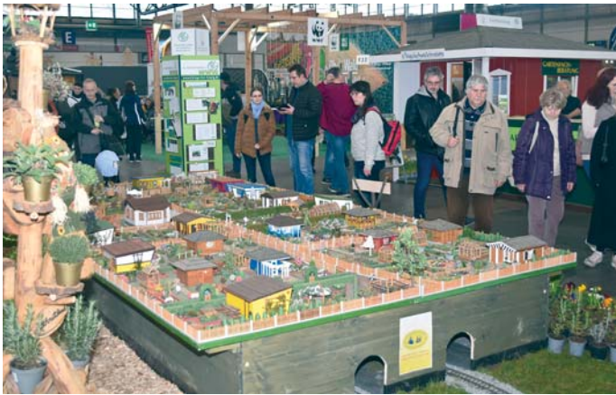
Das liebevoll gestaltete Modell einer Kleingartenanlage war für Erwachsene interessant.