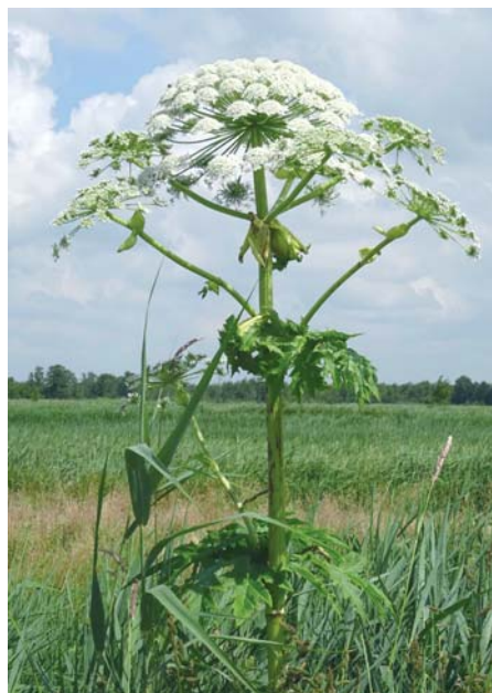
Der Riesens-Bärenklau kann schmerzhafte Hautschäden verursachen.

Als ernsthaftes Problem werden in Deutschland bisher jedoch nur relativ wenige Arten bewertet, die gebietsweise auch bekämpft werden. Dazu gibt es in Deutschland und in der EU inzwischen Listen von Arten, die als gefährlich gelten und sofort entfernt werden sollten, sobald sie in der Natur auftreten (Link am Ende dieses Beitrages). In Kleingärten verboten sind nur wenige, manche Vereine haben allerdings Listen mit unerwünschten Pflanzen erstellt.