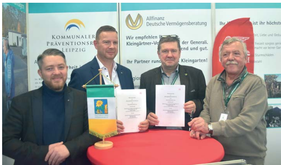
Am Rande der Messe „Haus-Garten-Freizeit“ wurde der neue Rahmenvertrag zwischen Generali und Stadtverband unterzeichnet.

Die Kleingärtner können in Zukunft den Wert ihrer Lauben und des In-