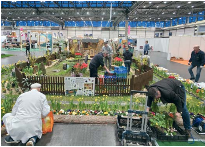
Das Aufbauteam hat gut gearbeitet, alles war pünktlich fertig.