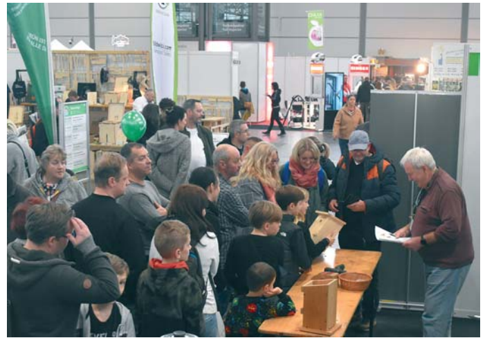
Kinder bauen Nistkästen war ein absoluter Publikumsrenner.