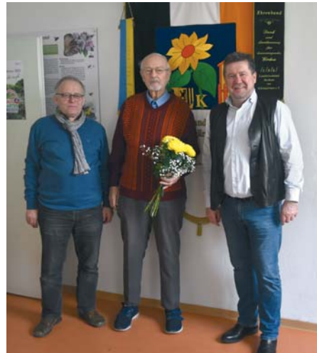
„Danke“ für langjähriges Wirken.

Bei so viel Engagement im Kleingartenwesen kann schon eine gewisse Menge an Verabschiedungen zusammenkommen. Gartenfreund Schröder