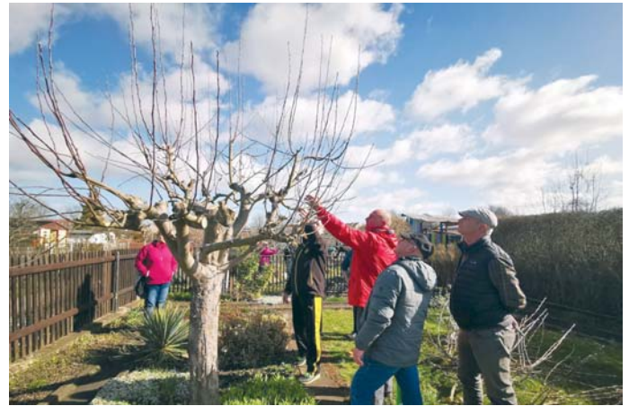
Praktischer Teil eines Baumschnittseminars.