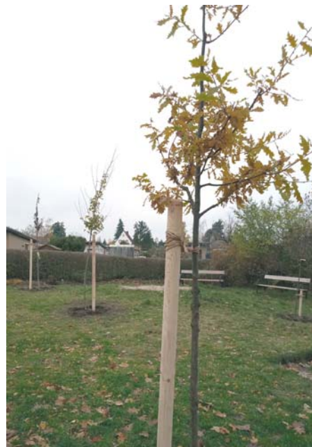
Elf Bäume und rund 100 Sträucher wurden gepflanzt.

Eine der wichtigsten Aufgaben, die vor uns liegt, ist das regelmäßige Gießen der neu gepflanzten Bäume. Besonders in trockenen Perioden ist dies von entscheidender Bedeutung, um sicherzustellen, dass die jungen Pflanzen ausreichend Feuchtigkeit erhalten.