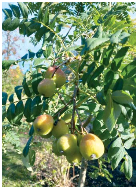
Der Speierling war 1993 „Baum des Jahres“ und gedeiht auch im Botanischen Garten Oberholz.

Seit der Antike wird der Speierling als Nahrungsmittel geschätzt. Bereits Theophrast (4. Jahrhundert v. Chr.), Plinius (1. Jahrh. v. Chr.) und Karl der Große (8. Jahrh.) priesen dieses Obst-