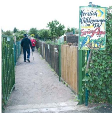
2009 war die „Grüne Aue“ ein Etappenziel bei der 5. Wanderung durch Leipziger Kleingartenanlagen, 2024 wird die Anlage erneut „angelaufen“.

Das reichhaltige Vereinsleben wurde von der Entwicklung der 1930er Jahre überschattet. Im Mai 1933 erfolgte die Gleichschaltung. Der Vereinsvorstand wurde durch einen benannten Vereinsführer ersetzt und das Vereinsleben nach strengen Vorgaben, die keinen Spielraum offenließen, organisiert. Im Jahr 1934 wurde der Verein aufgelöst und dem KGV „Vereinigter Kleingärtner Ostau“ e.V.