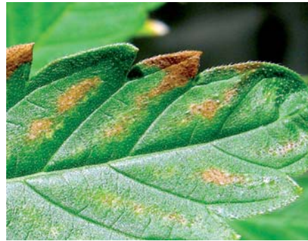
Bei Überdüngung drohen Verbrennungen.

Für Fachberater ist die Auffrischung schon gehörter Maßnahmen ein Muss, denn es sind wiederkehrende Probleme. Doch mindestens ebenso wichtig ist die ständige Weiterbildung, das Hinzulernen. Der Fachberater, der auf dem neuesten Stand ist, weiß, welche Obst- oder Gemüsesorten widerstandsfähig sind oder welche Dünger problemlos angewendet werden können.