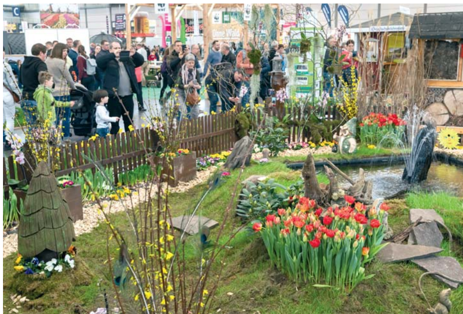
Bunte Gartenträume auf der Haus-Garten-Freizeit.

Weitere Infos finden Sie im Netz auf www.haus-garten-freizeit.de sowie www.handwerksmesse-leipzig.de