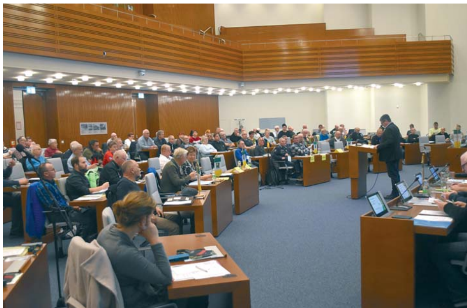
Die Delegierten der Kleingärtnervereine bei der Mitgliederversammlung des Stadtverbandes im Sitzungssaal des Neuen Rathauses.