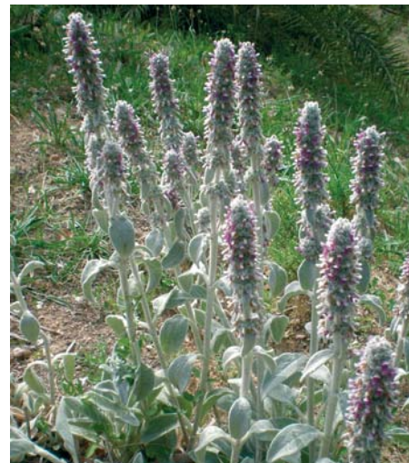
Blühender Wollziest ( Stachys byzantinica ).

Quelle: Edgar Schmitt, „Leipziger Gartenfreund“ 11/2018